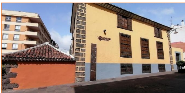
Az iskola épülete a 16. századból való