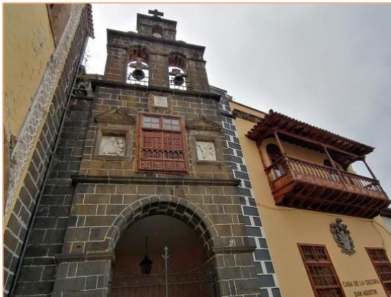
Harangok és tornác a gyarmati időkből