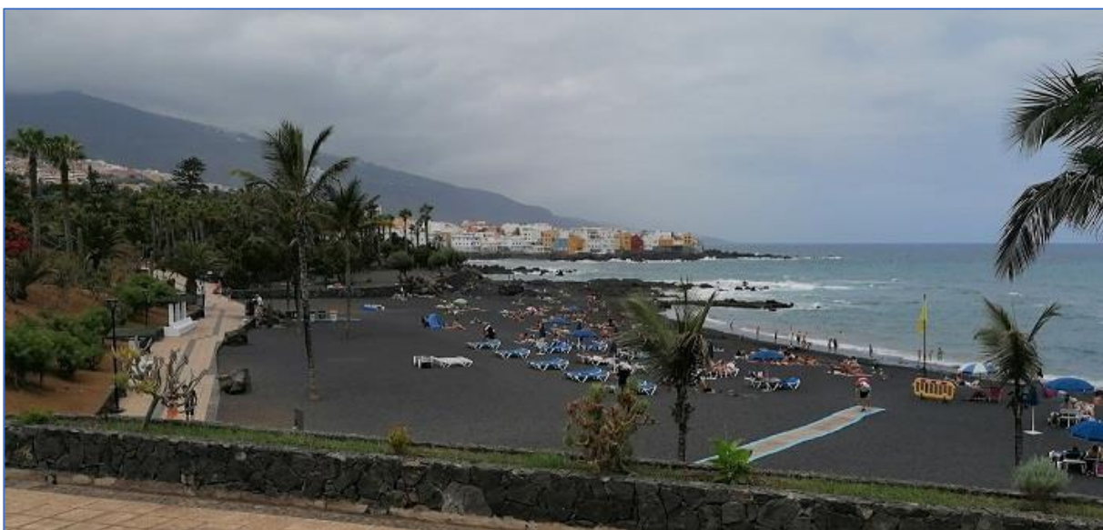
Jellegzetes fekete homokos tengerpart