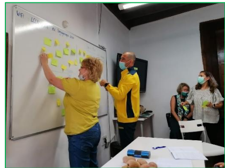
Miben különbözhetünk? - órai munka

Az első napon megbeszéltük mit is jelent a sokszínűség egy osztályteremben. Mi mindenben különbözhetnek egymástól a gyerekek? Miután teleírtuk a táblát, gyakorló tanárokként is elcsodálkoztunk, mennyi mindenre kell(ene) figyelni ahhoz, hogy minden tanuló figyelmét felkeltsük és le is kössük egy teljes délelőttön át. Arra a konklúzióra jutottunk, hogy a mindenre, egyszerre nem tudunk figyelemmel lenni. Amit tehetünk, az a barátságos, biztosságot adó légkör megteremtése az osztályteremben, amely hozzásegít minden gyereket ahhoz, hogy kibontakoztassa önmagát (Brain Friendly Classroom).