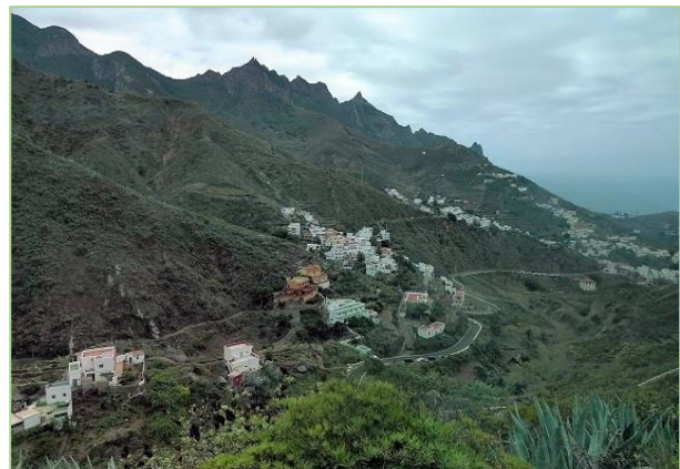
Kanyargós út a hegyekből az óceánhoz